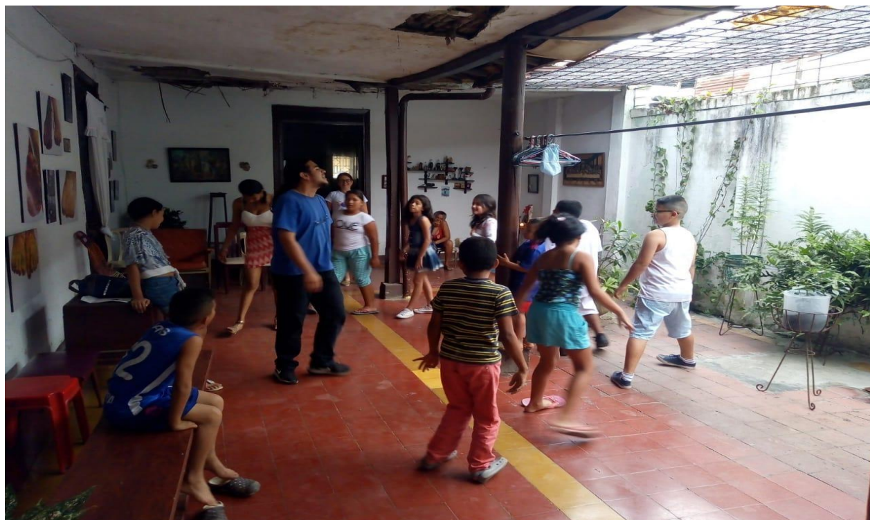
Ilustración 12. Taller de Teatro. Autor Frank San Martín 2019.

gustó mucho en el grupo, pero como era en recocha él no quería hacerlo así en la obra, pero entre todos lo convencieron y terminó haciendo de esa forma.