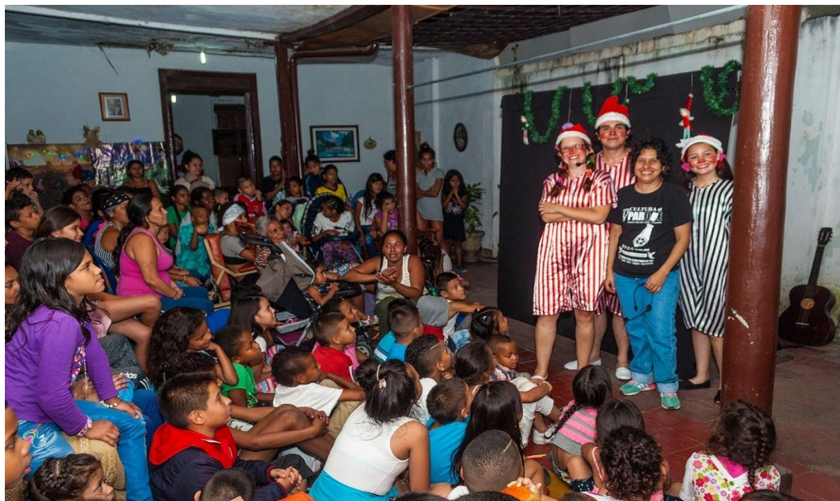
Ilustración 7. Obra navideña.