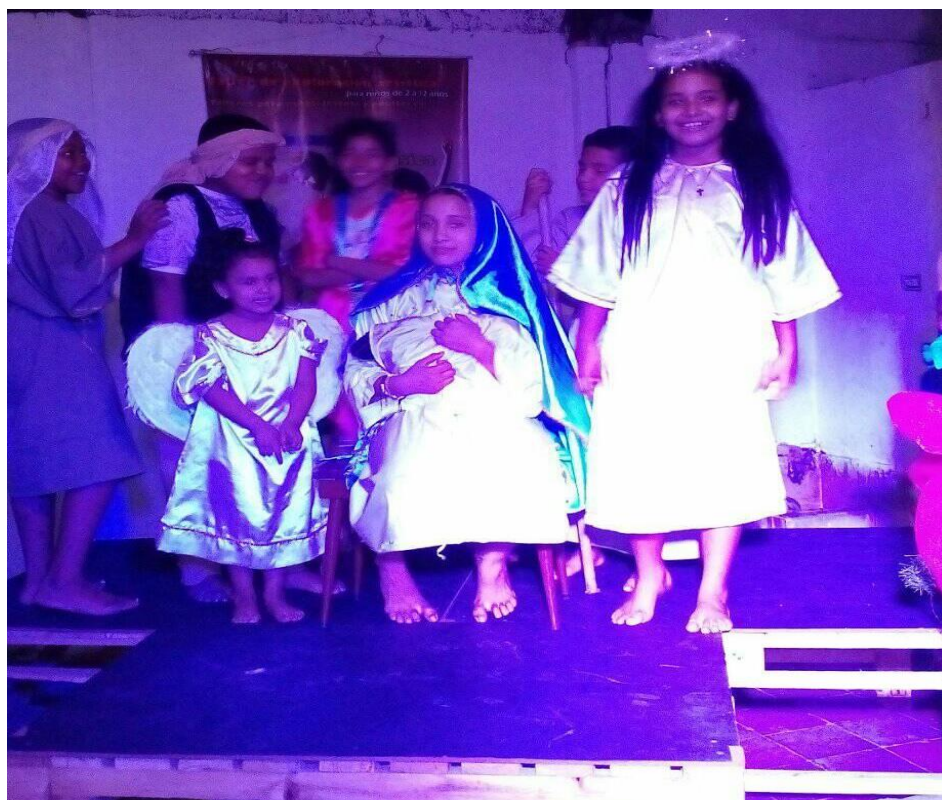
Ilustración 9. Pastorela navideña 2. Autor Frank San Martín 2019.

Al cuarto año y sin repertorio se decide hacer una convocatoria para invitar a los niños a hacer teatro y música todos los sábados de 3 a 5 de la tarde, la intención nunca fue darles la súper educación artística o volverlos artistas. Si bien daríamos refrigerio, había que participar en todas las clases y toda la clase para ganárselo y lo más importante, que se estaba bajo voluntad propia y que si no iba a estar en clase debía retirarse o propiciar un buen ambiente de trabajo para el desarrollo artístico de los demás compañeros... además dando como resultado un coro navideño y una pastorela teatral, que se debía presentar en diciembre (Ver ilustración 8).