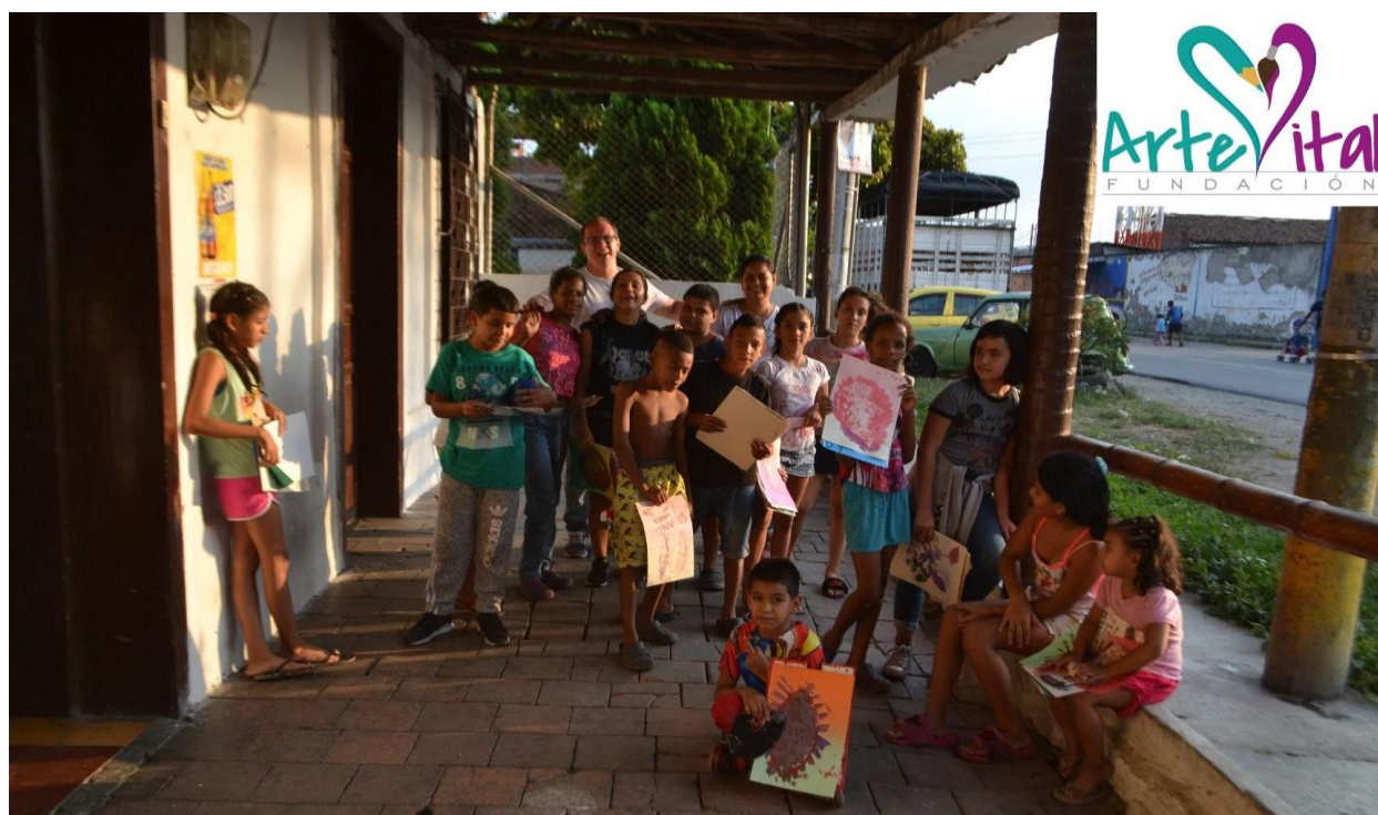
Ilustración 14. Arte vital.