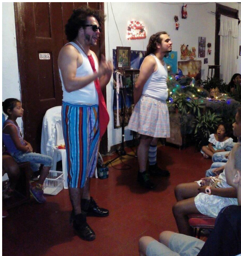
Ilustración 8. Esperpento navideño. Autor Frank San Martín 2018.

qué más, qué te decían ay ¿te volviste una loca?”.