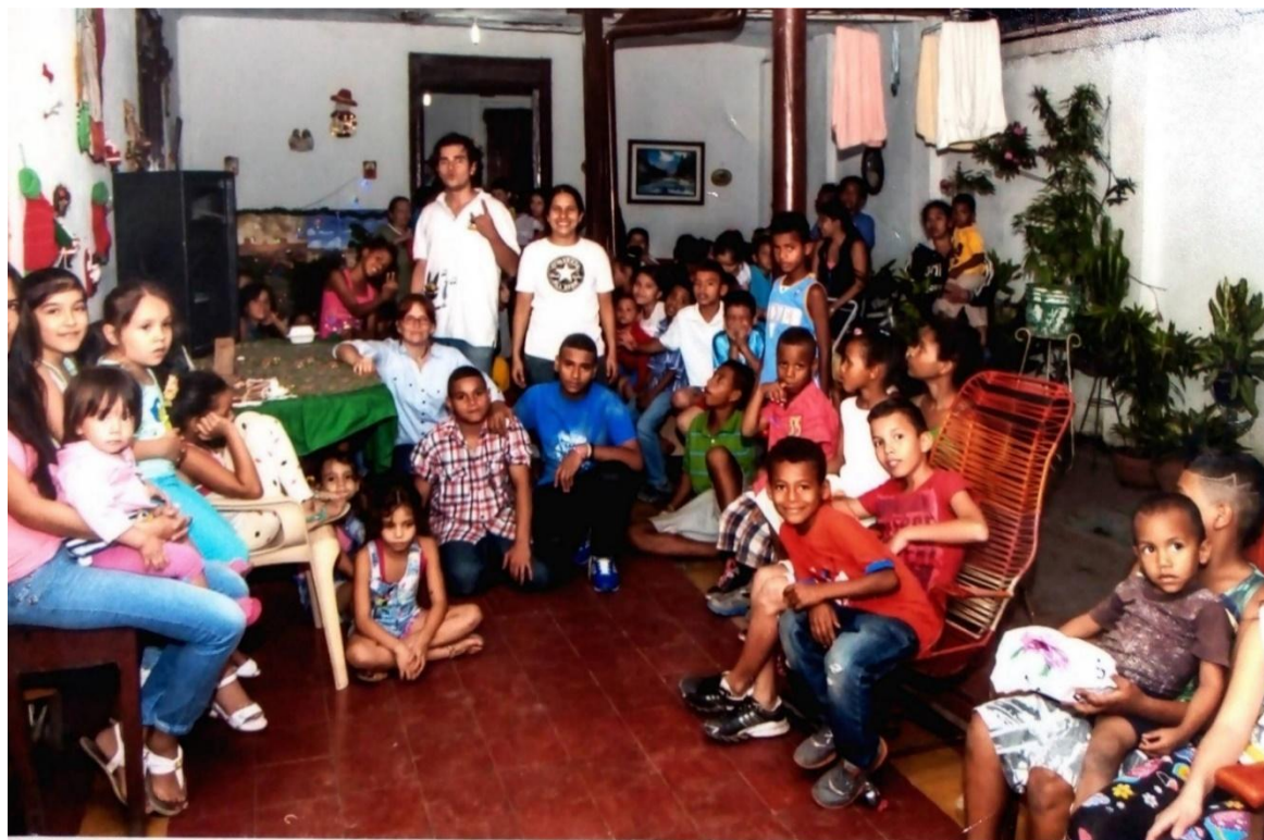
Ilustración 6. Novena 2016. Autor Juan Carlos Pineda 2016.

En ese momento supe que podría ser difícil, pero en definitiva sí funcionaba. El arte para llegar a ellos es una maravilla. De cierto modo yo compartía su apatía hacia cualquier cosa, había estado justo en su lugar y fue gracias a que fortuitamente conocí el teatro que poco a poco me alejé del barrio y me acercaba más al arte. Sin darme cuenta pasaron los años, yo ya me desempeñaba en el oficio del teatro y los títeres; varios de los chicos me distinguían del barrio, muchos sabían quién era mi mamá y ni qué hablar al ver los rostros de mis compañeros de clase en la niñez replicados en sus hijos. Me sentí aún más comprometido.