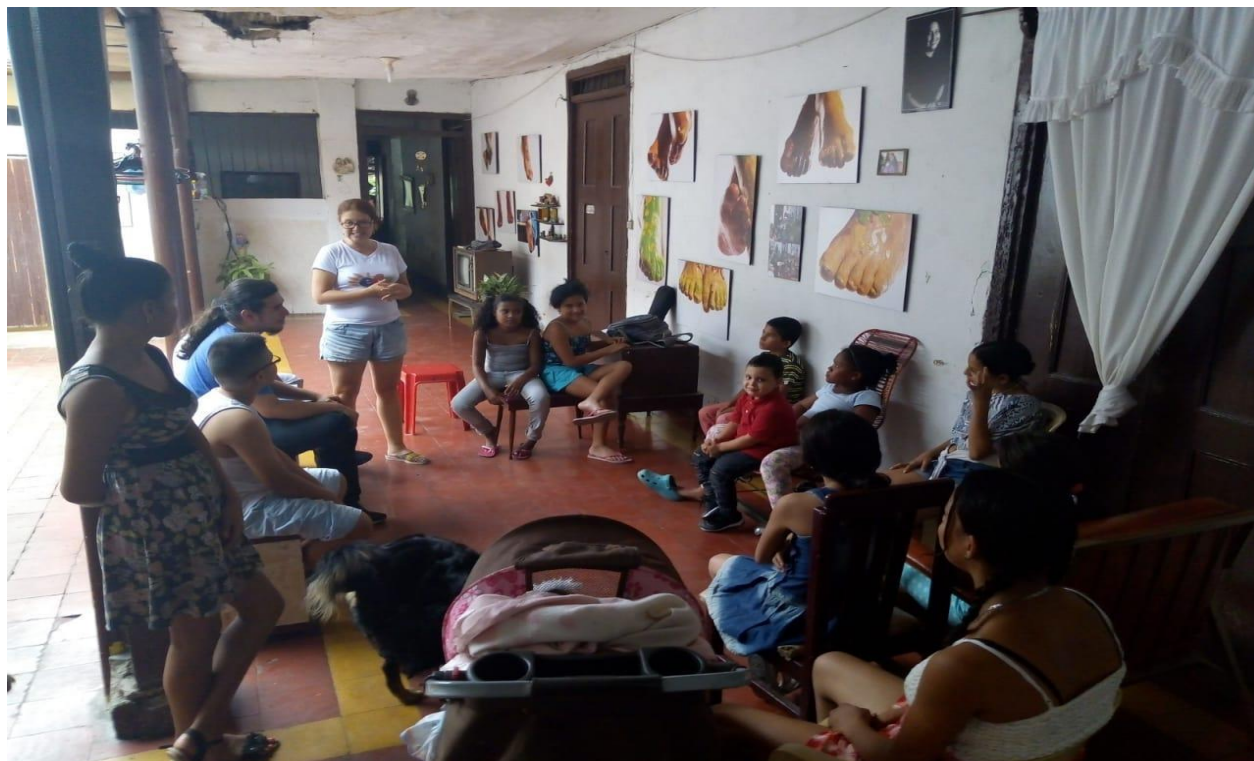
Ilustración 10. Taller de música. Autor Frank San Martín 2019.

Durante esta clase hubo un momento donde el profesor de teatro perdió los estribos cuando una de las estudiantes, La Kimby, peleaba con el resto del grupo, gritaba, les golpeaba, usaba malas palabras, no participaba en el desarrollo de los ejercicios, ni permitía que otros se concentraran en el momento de prestar atención, haciendo que otros estudiantes consideraran la idea de no volver. Podría considerar esta la discusión más fuerte de todo el taller; La Kimby era una estudiante que se caracterizaba por causar conflictos y aunque se intentó hablar con ella no paraba de gritar hasta que el docente igualó su tono de voz gritándole: “el que quiera estar se puede quedar y si no, váyase tranquila que aquí no se está obligando a nadie y si cree que está perdiendo el tiempo, es libre de marcharse cuando guste”. Ahora que lo pienso, esta acción que podría catalogarse como violenta, tiene un trasfondo con unas implicaciones más profundas de lo que parece, fue como decirle: “yo aquí en este espacio soy tu profesor y te puedo tratar con mucho amor, pero sí tú me tratas como en la calle, yo