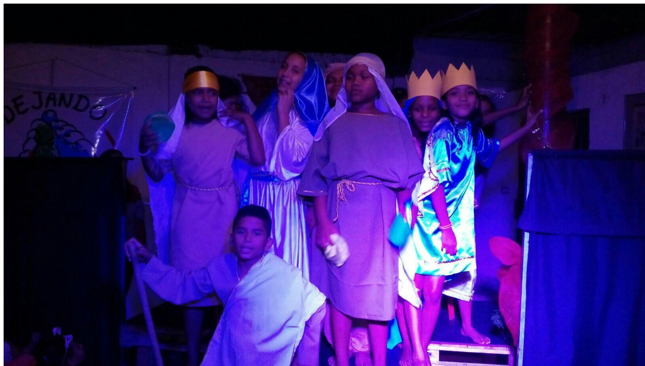
Ilustración 13. pastorela navideña. Autor Juan Carlos Pineda 2019.

atentos, yo no lo podía creer... Fue mágico.