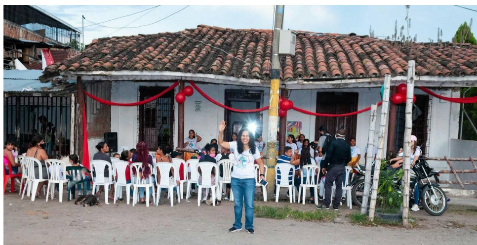
Ilustración 3. La casa de Gloria. Autor Juan Carlos Pineda 2019.