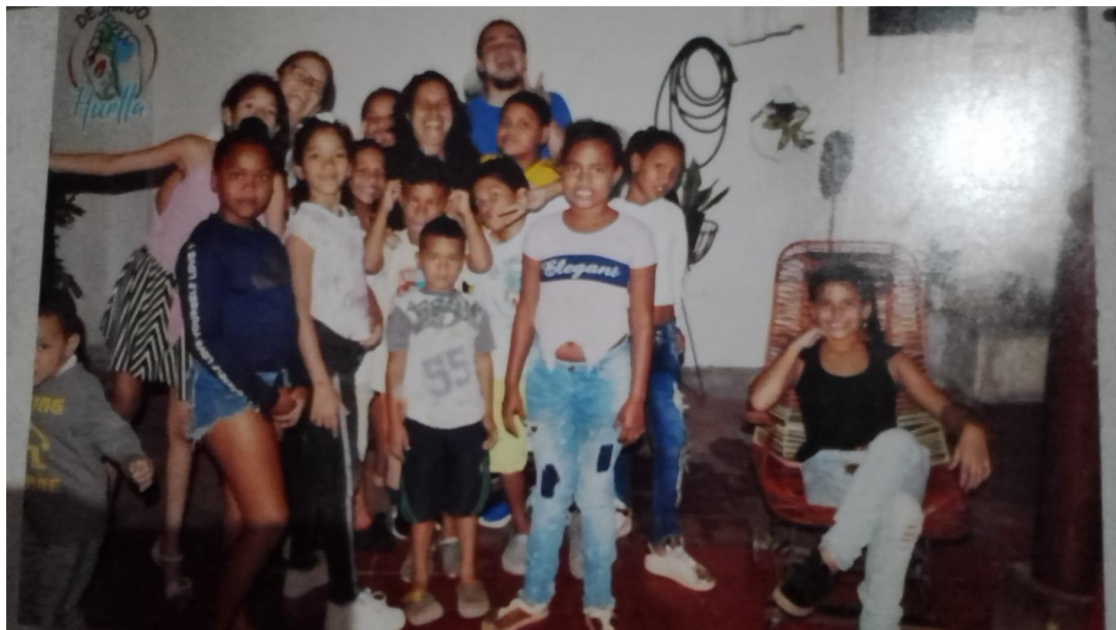
Ilustración 11. Los de la obra. Autor Juan Carlos Pineda 2019.

En esta ocasión se empezó con la clase de teatro, comenzamos con juegos de desplazamiento, con un componente vocal y combinando de distintas maneras las alturas y velocidades. Se jugó a la estatua, en la cual a la señal de un número todos deben congelarse representando un ser u objeto de su interés y de manera individual; luego se pasó a jugar a la fotografía donde los chicos también deben congelar el movimiento, pero esta vez entre varios, llegando gradualmente a vincularlos en una sola fotografía y representando una situación. Mediante estos juegos teatrales se empezaron a mezclar sin darse cuenta y ver que ellos también querían y podían expresar los motivó a participar más.