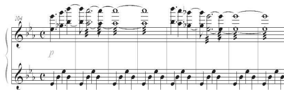
48. Sentido de ligado en la melodía

En la segunda estructura el motivo melódico se expone generalmente en octavas y con abundantes redobles en la mano derecha, el intérprete debe buscar que las notas largas sean continuas y los cambios de notas lo menos brusco posible, como si se tratara de un coral.