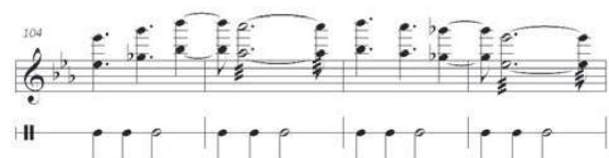
46. Motivo rítmico y melódico, registro agudo

La segunda estructura, elaborada de forma similar a la anterior, es totalmente contrastante en su sentido agógico y en el uso del registro agudo de la marimba.