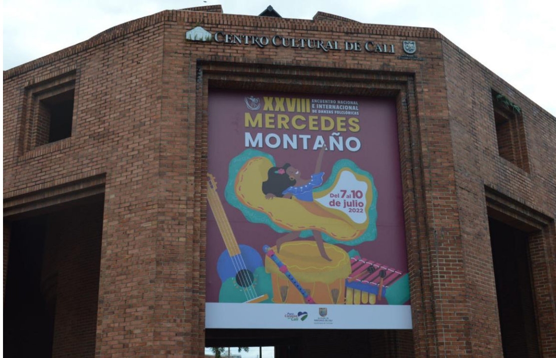
Figura 15: Cartel 28 Encuentro Nacional e Internacional Mercedes Montañó 2022. Imagen de autoría propia, Happy Studio