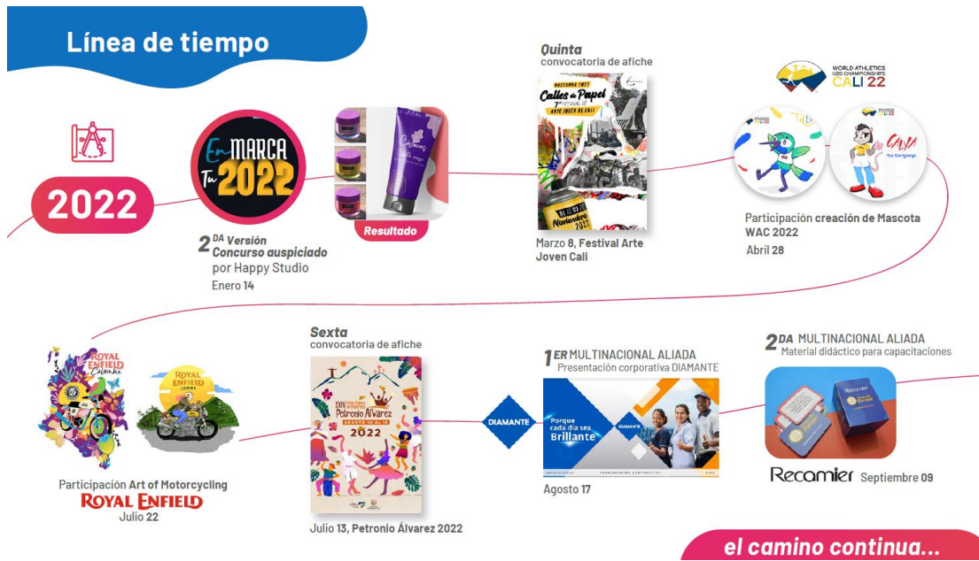
Figura 3: Línea del tiempo, proyectos 2022, Imagen de autoría propia, Happy Studio.