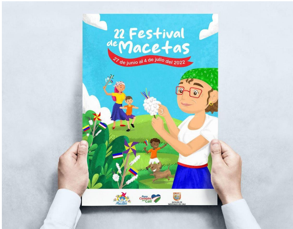
Figura 12: Cartel 22 Festival de Macetas 2022.