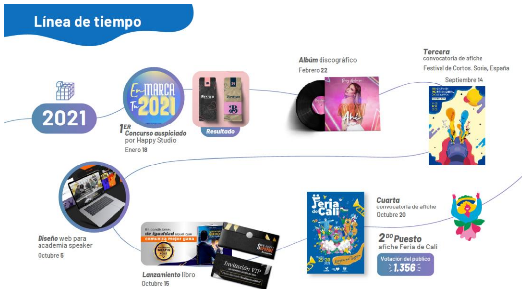
Figura 2: Línea del tiempo, proyectos 2021, Imagen de autoría propia, Happy Studio.