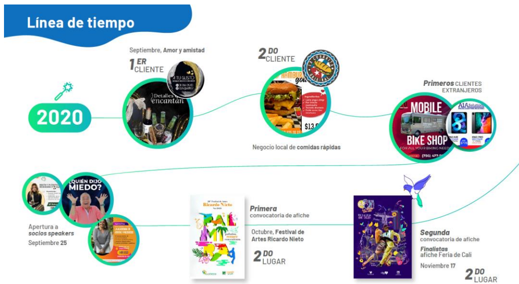
Figura 1: Línea del tiempo, proyectos 2020, Imagen de autoría propia, Happy Studio.