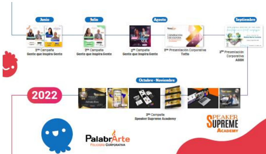
Figura 7: Línea del tiempo cliente Jaime Riascos, proyectos 2022.