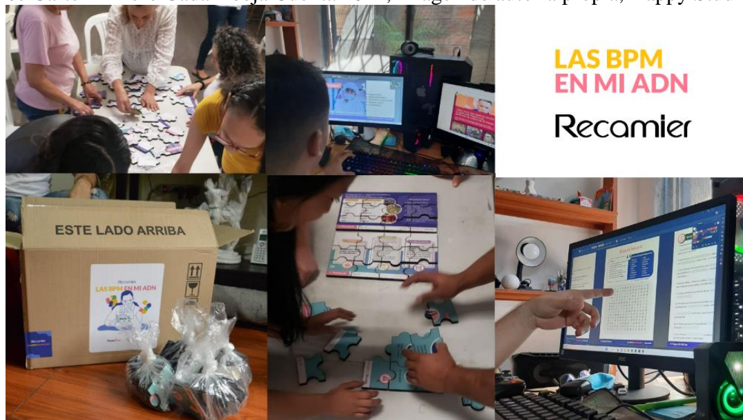
Figura 11: Entregables Las BPM en mi ADN desde la realización hasta su entrega.