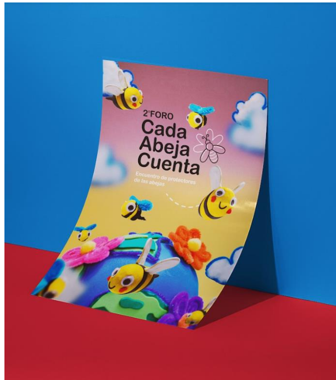
Figura 10: Cartel 2º Foro Cada Abeja Cuenta 2022, Imagen de autoría propia, Happy Studio.