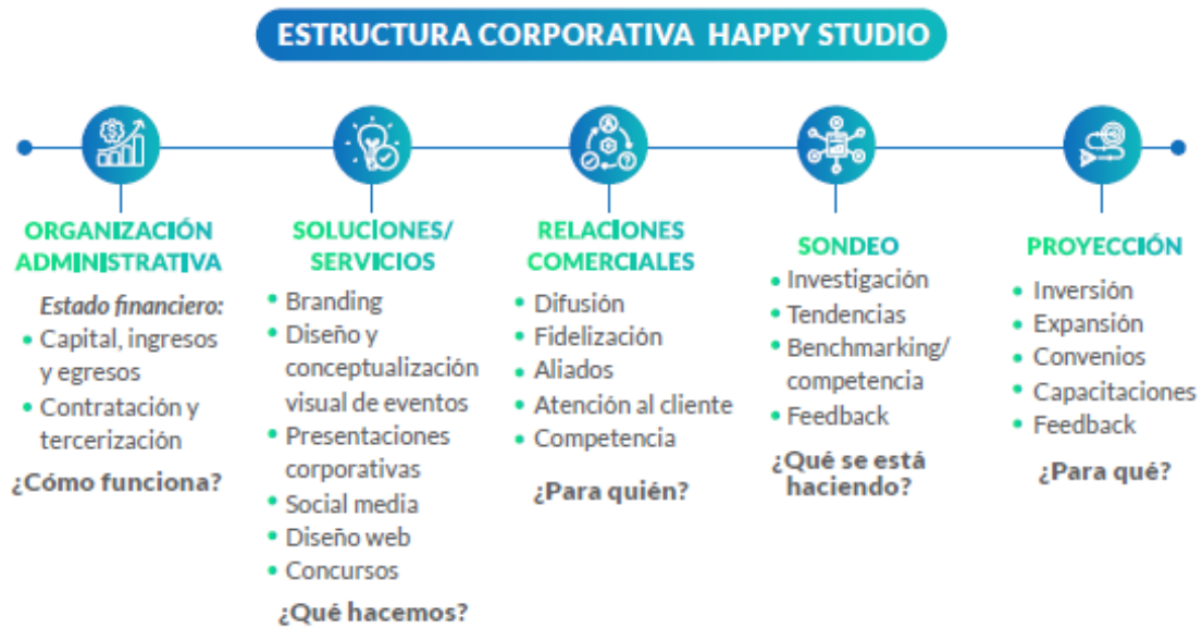
Figura 5: Estructura corporativa, diagrama de tareas administrativas. Imagen de autoría propia, Happy Studio.