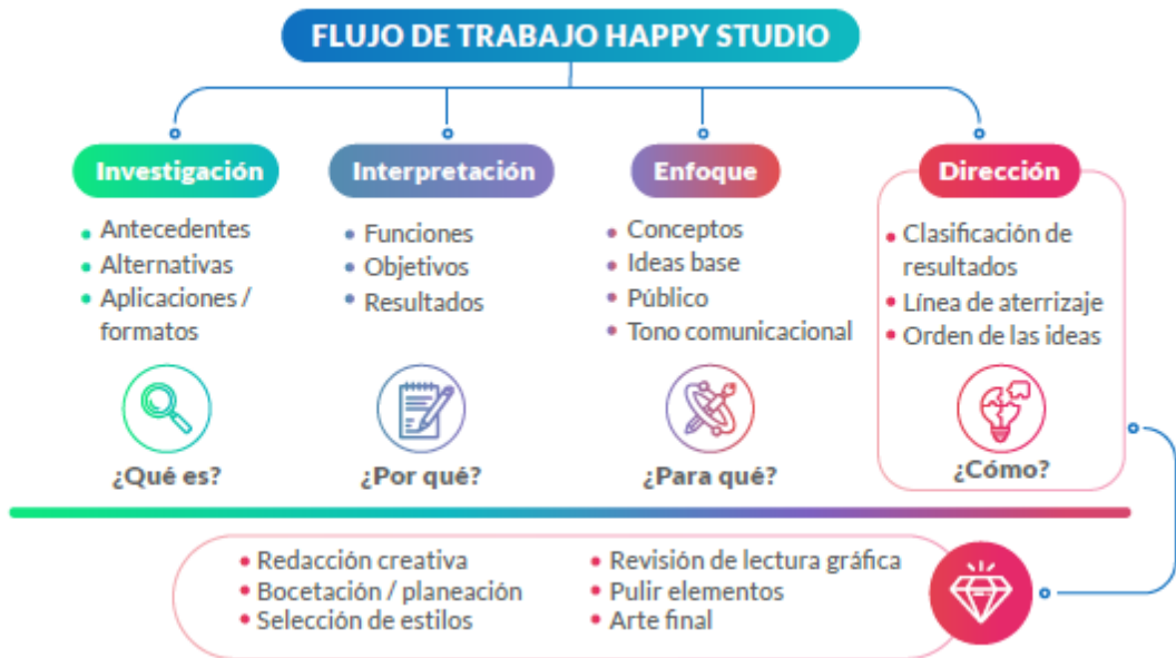
Figura 4: Flujo de trabajo, diagrama de gestión organizacional para desarrollo de proyectos creativos. Imagen de autoría propia, Happy Studio.