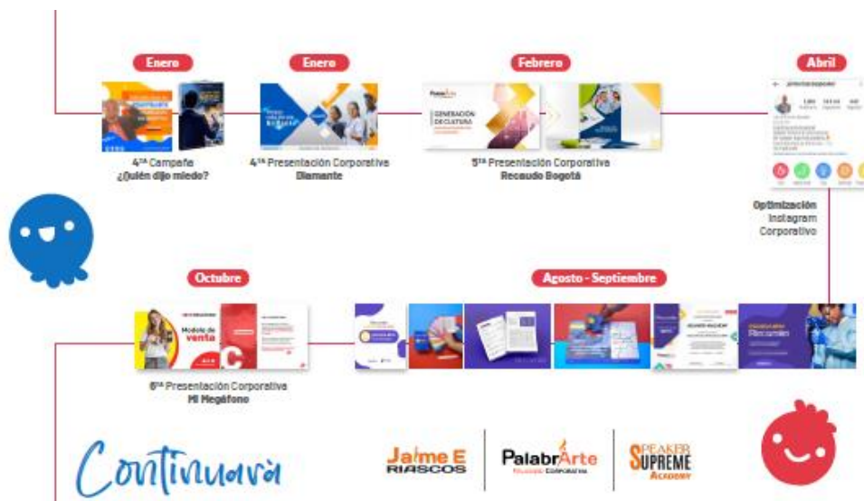
Figura 8: Línea del tiempo cliente Jaime Riascos, proyectos 2022, Imagen de autoría propia, Happy Studio.