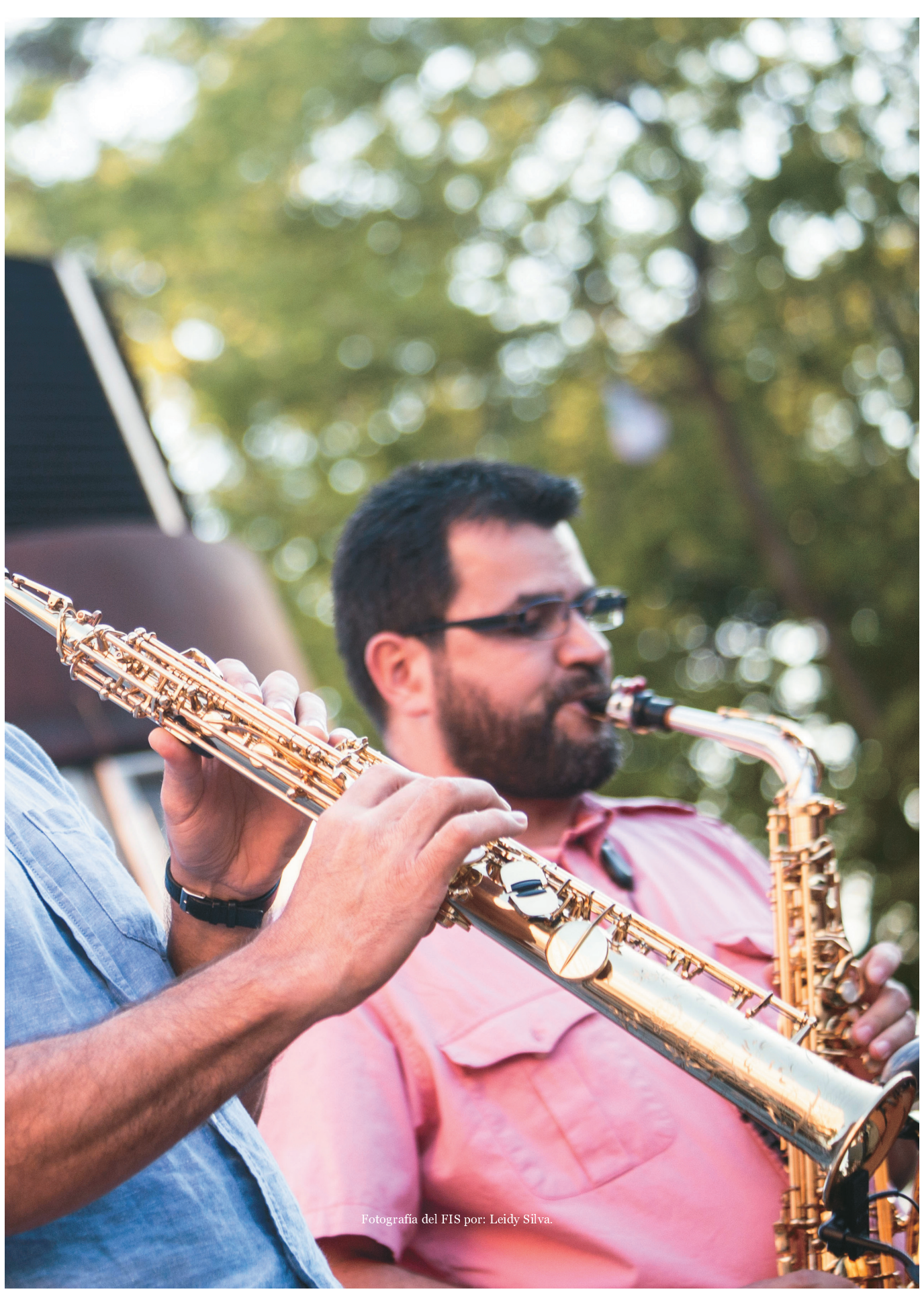
Fotografía del FIS por: Leidy Silva.