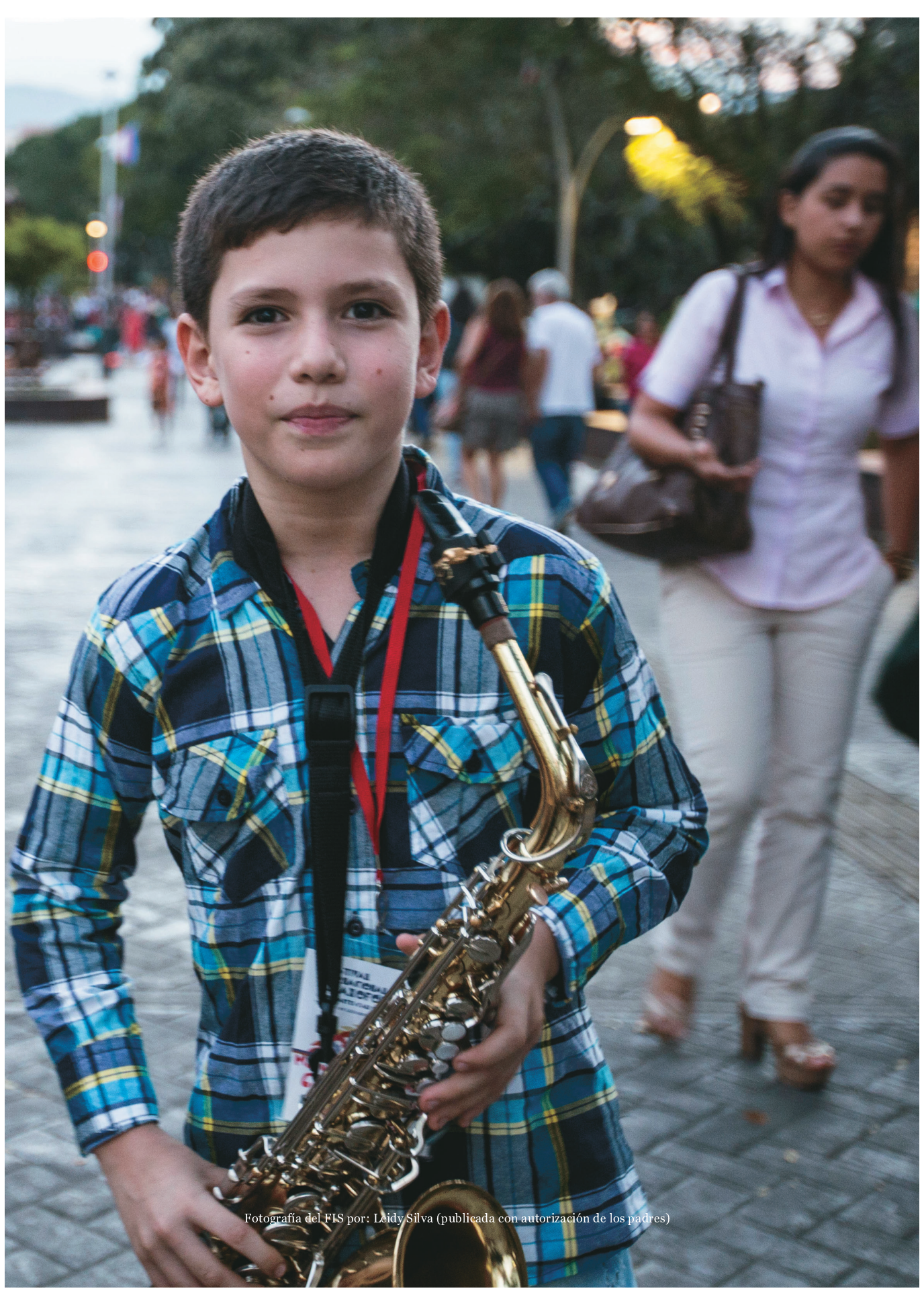
Fotografía del FIS por: Leidy Silva (publicada con autorización de los padres)