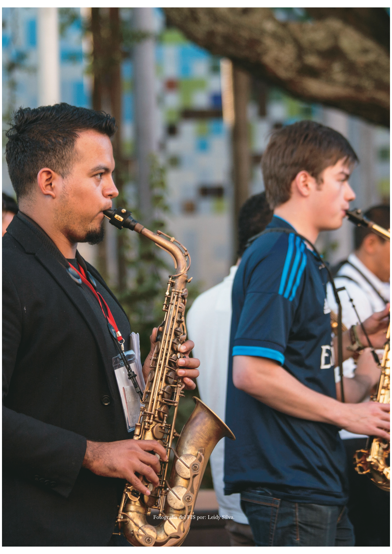
Fotografía del FIS por: Leidy Silva.