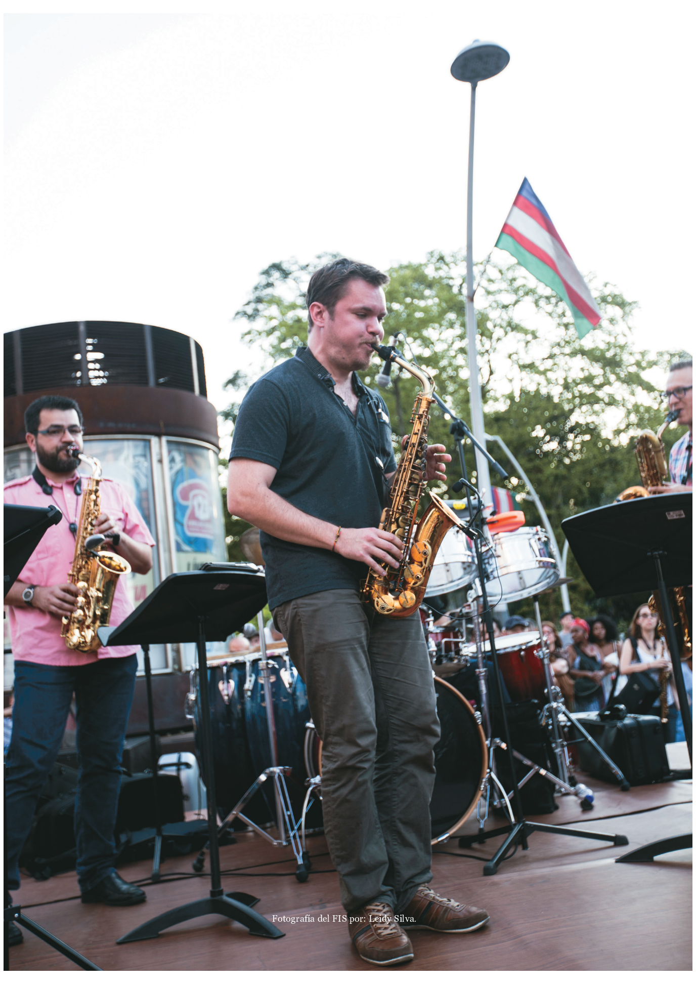
Fotografía del FIS por: Leidy Silva.