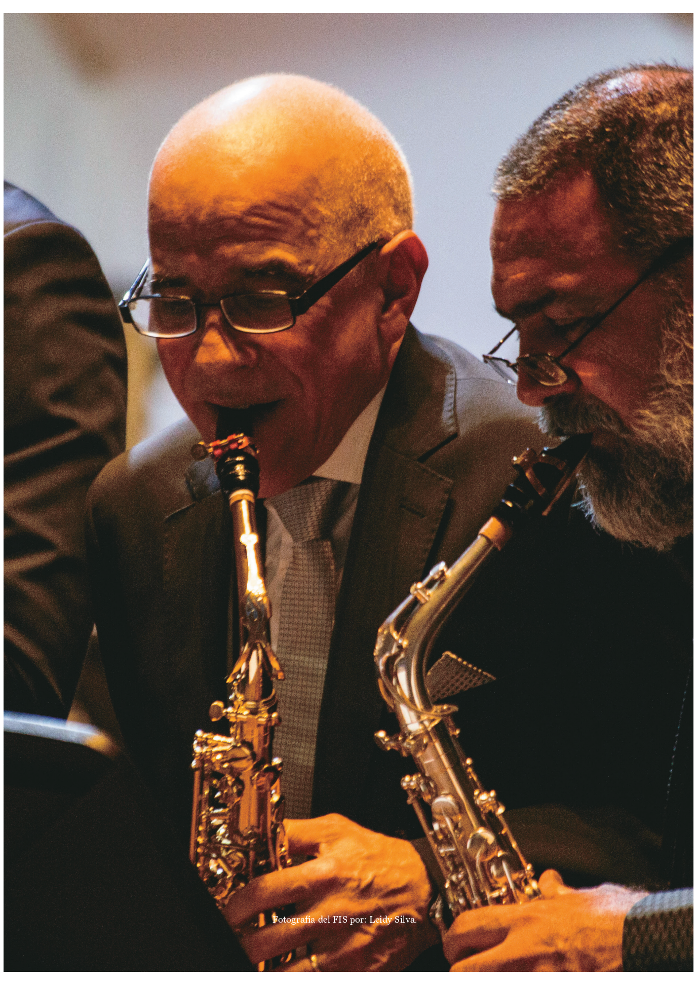
Fotografía del FIS por: Leidy Silva.