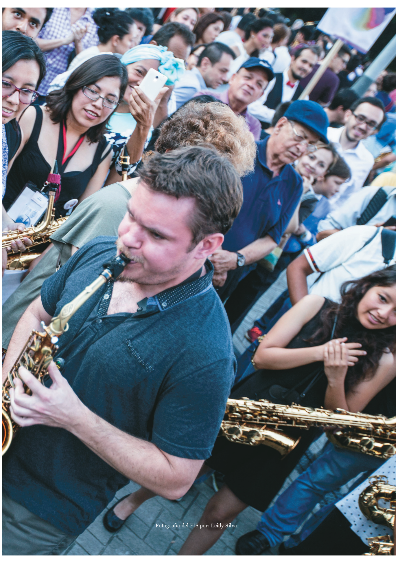
Fotografía del FIS por: Leidy Silva.