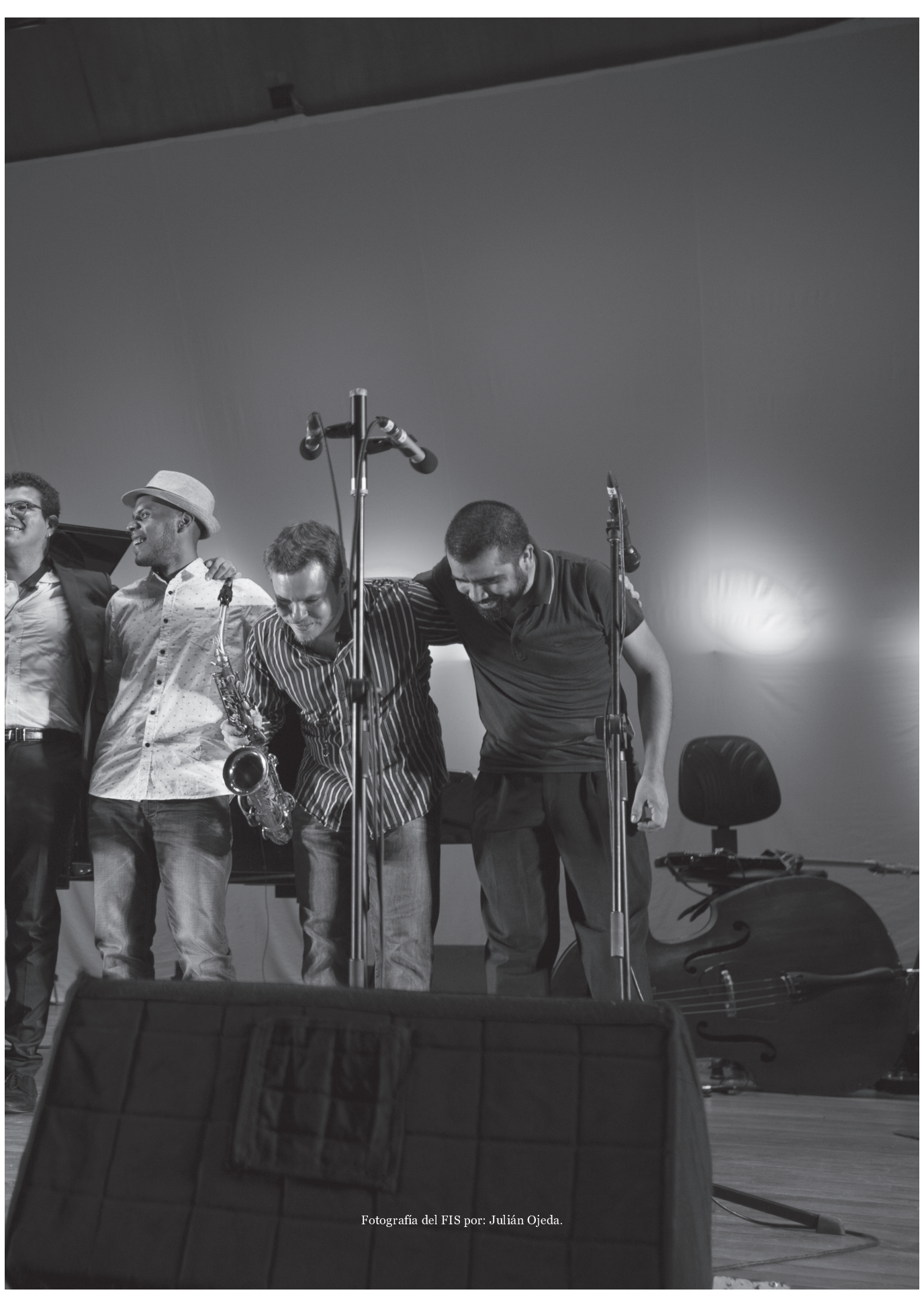
Fotografía del FIS por: Julián Ojeda.