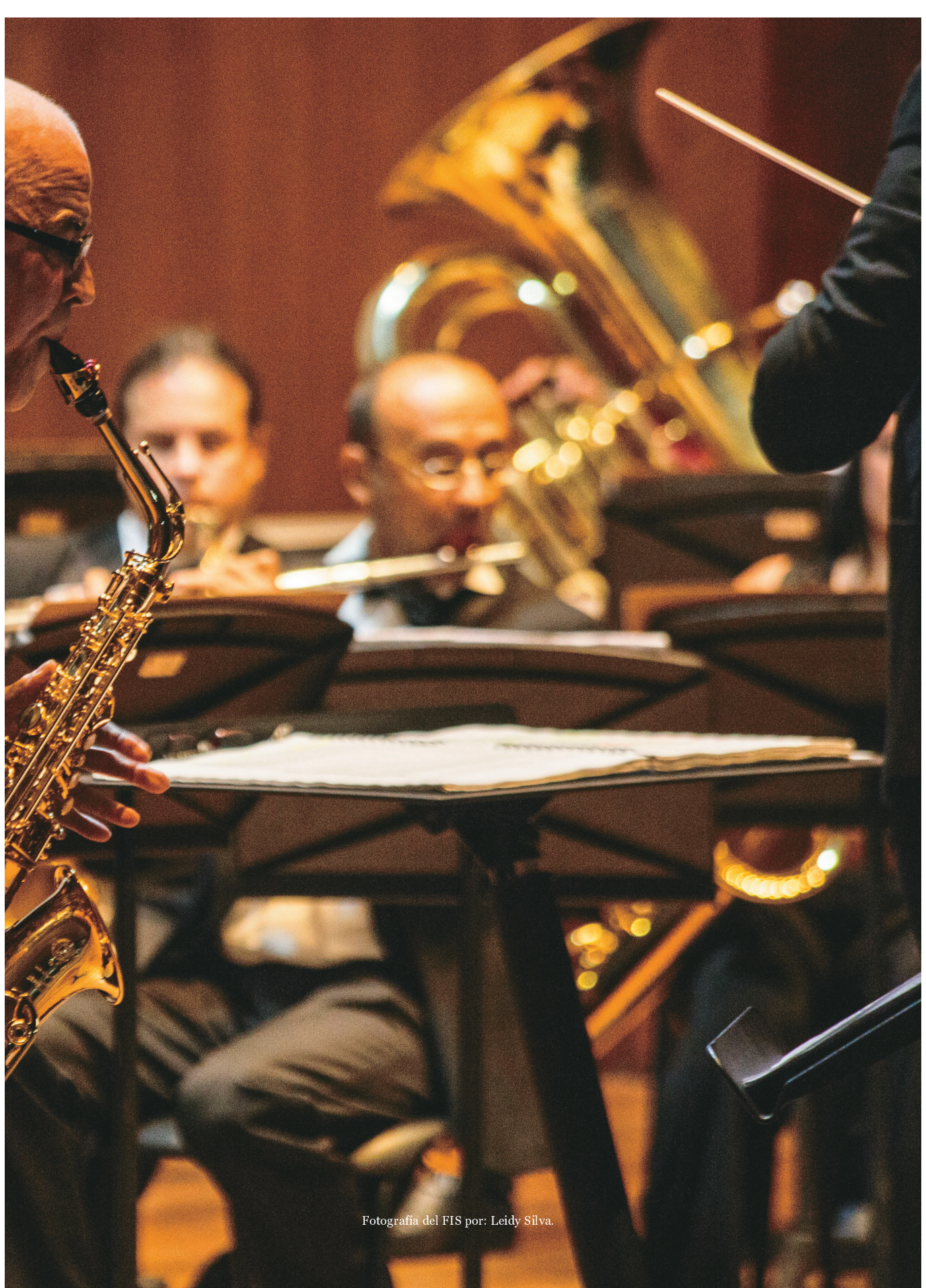
Fotografía del FIS por: Leidy Silva.