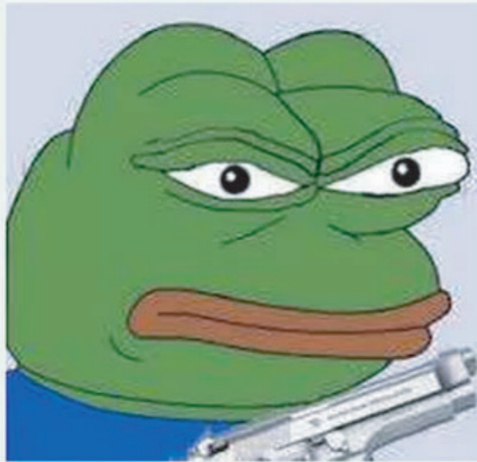
6KiB, 200x194, Pepe_gun.jpg