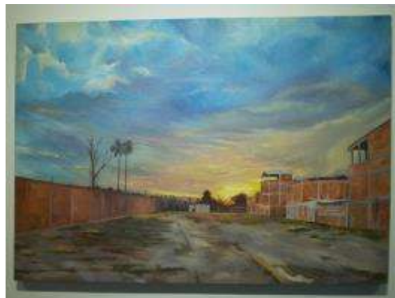
Antigua fábrica de puntillas, Óleo sobre lienzo, 2019

El artista se asume como etnógrafo a través del ejercicio pictórico que documenta las experiencias, anécdotas y testimonios de la vida cotidiana de los habitantes del corregimiento de Villa Gorgona, Candelaria-Valle, que ha venido siendo transformada como consecuencia de procesos de la industrialización.