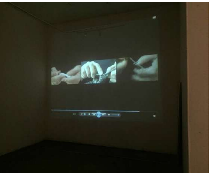
Herencia, Andrea F. Urrea, video: loop. 2018

La ritualidad del tejido y el bordado ha estado vinculado con ese “buen deber ser” de las mujeres que impone la iglesia católica: mujeres sumisas, devotas, obedientes, dedicadas a oficios aparentemente menores y en actividades de aprovechamiento del espacio libre que, esas sí, no conspiran contra la estabilidad del hogar ni cuestionan la preeminencia del hombre. Aquellos oficios manuales que las mujeres asumieron como una tarea de esparcimiento, no obstante, me dan la clave de otra cosa: también son espacios de encuentro, donde en algún momento ellas empiezan a preguntarse más y más cosas, a declarar su insatisfacción en torno a la monotonía, quizás en torno a sus cuerpos y a la potestad que tienen sus esposos respecto a ellos. Y así como un día las mujeres tejieron de forma silenciosa, hubo también el momento en que empezaron a hacerse escuchar, unidas y reunidas en sororidad, para cambiar el estado de cosas.