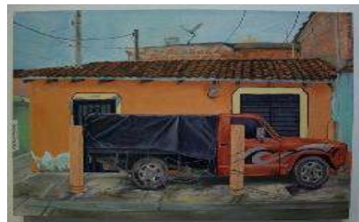
Empacadores de Verduras, Óleo sobre lienzo, 2019