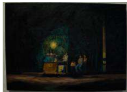
Vendedora de Fritanga, Óleo sobre lienzo, 2019